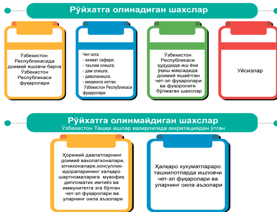
3-расм. Аҳолини рўйхатга олиш жараёнида рўйхатга олинадиган ва рўйхатга олинмайдиган шахслар 7

3- расм маълумотларидан маълум бўляптики, аҳолини руйхатга олишни шартли равишда иккига руйхатга олинадиган шахслар ва руйхатга олинмайдиган шахсларга ажратилган. Рўйхатга олинадиган шахсларни ўзи куйидаги шартли тўртта груҳга ажратилган: